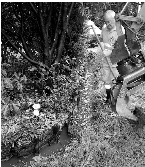
Rückbau einer maroden Bachverbauung am Grünenbächli ...