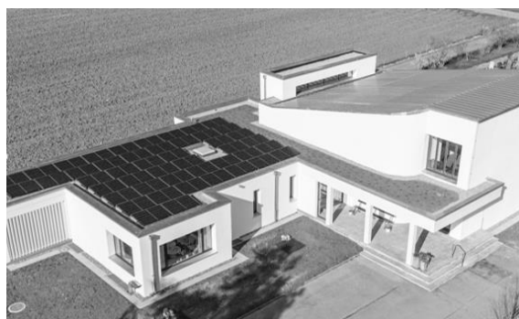
Die Abdankungshalle erstrahlt im neuen Glanz (inkl. PV-Anlage).

Die Aufbahrungs- und Abdankungsräume wurden saniert, weshalb weniger Aufbahrungen und Abdankungsfeiern stattfanden. Die Bestattungen wurden davon nicht beeinträchtigt.