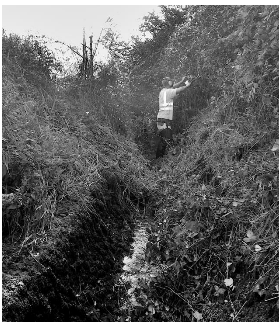
Gehölzpflege im kanalisiertem Teil des Oberholzbaches.

Sehr arbeitsintensiv war – wie jedes Jahr – der Gewässerunterhalt mit manuellem Mähen der Sohle und der Ufer-Böschungen. Ebenso die Pflege der Bäume und Sträucher. Wo möglich wurde die Gehölzpflege von ausserhalb des Gewässers erledigt. Dies war aufgrund der Zugänglichkeit aber nicht überall möglich. Teilbereiche kleinerer Gewässer wurden, soweit ausführbar, durch die Werkhofmitarbeiter revitalisiert.