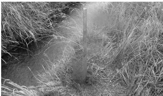
Pflanzensetzen an verschiedenen Standorten.

Im Herbst wurden an verschiedenen Standorten Pflanzen gesetzt.