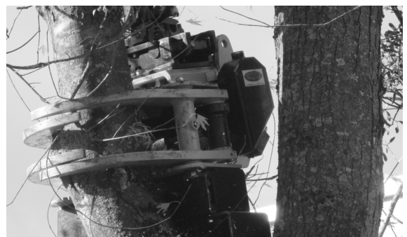
Die Bäume wurden mit Hilfe eines Kappgerätes gefällt.