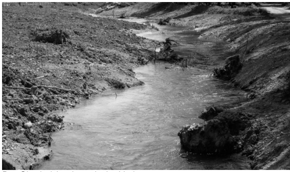
Der Oberholzbach nach der Umlegung.

Eine wilde Deponie von rund 40 Alt-Pneus musste im April beseitigt werden.