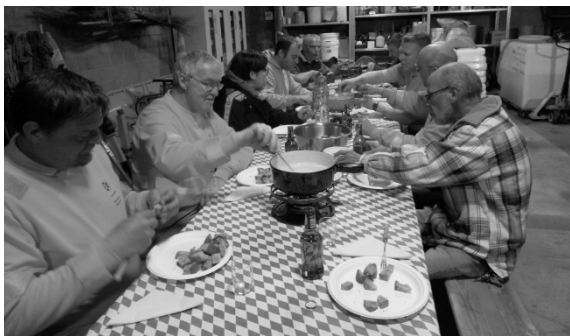
Gemütliches Beisammensein beim traditionellen Fondue-Essen.

Im Februar fand das jährliche Fondue-Essen der Werkhofteams Bätterkinden, Utzenstorf und Wiler statt.