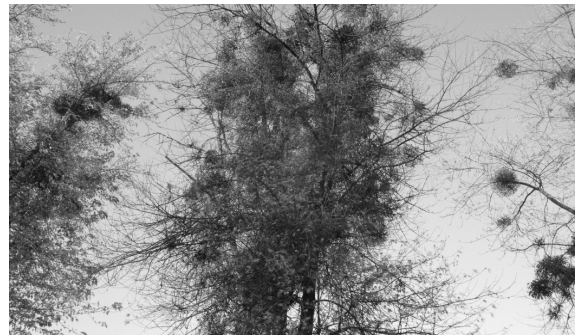
Mistelbefall an Bäumen auf dem Friedhofareal.

Auf dem Friedhofgelände mussten im November mit Hilfe eines Kappgerätes Bäume gefällt werden.